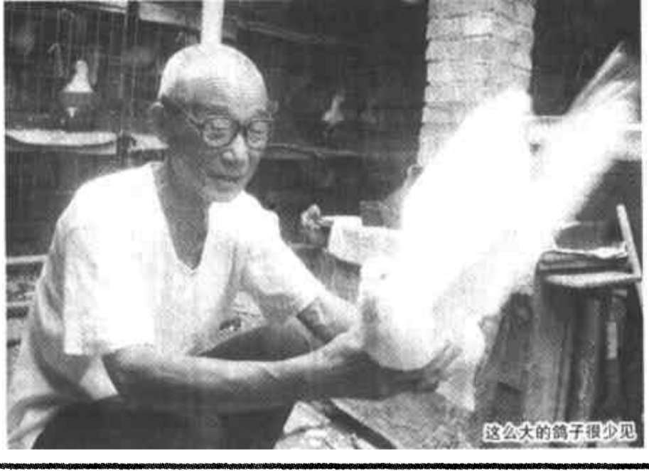
这么大的鸽子很少见