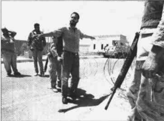
8月22日,在伊拉克首都巴格达以西100公里的拉马迪,美军士兵正在对一名伊拉克人进行搜身。