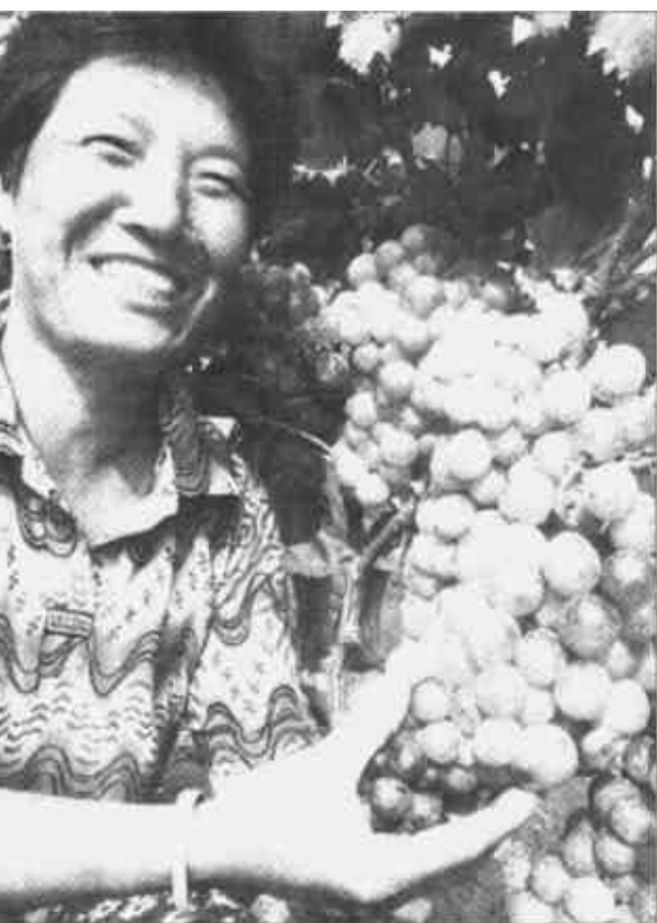
利津县在继续巩固上农下渔成果的同时，不断调整、优化产业结构。图为陈庄镇治河村去年引种的30亩美国超级无核葡萄今年已进入盛果期，亩产达3000公斤，仅此一项全村增收近40万元。

西牧林 韩宏方 自广饶县开展“三级联创”活动以来，稻庄镇畜牧兽医工作站以创建群众满意站所出发点，7月份成立了镇家畜改良站，免费向社会提供家畜改良业务。向养殖户提供产前、产中、产后服务的稻庄镇肉禽鸡生产合作社也正在建设中。