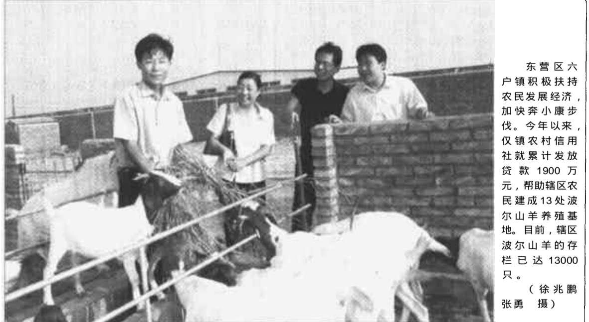
东营区六户镇积极扶持农民发展经济，加快奔小康步伐。今年以来，仅镇农村信用社就累计发放贷款1900万元，帮助辖区农民建成13处波尔山羊养殖基地。目前，辖区波尔山羊的存栏已达13000只。

本报讯 近日，我市第五期（2000—2002年）农业综合开发顺利通过省级验收。 我市第五期农业综合开发共实施57个项目，其中土地治理项目39个，改造中低产田42.3万亩，建设多种经营项目18个，累计总投资23930万元，其中省以上投资10826万元。 省验收组认为，东营农业综合开发思路新，项目突出了专家规划，构筑了现代农业框架；建设内容突出了科技项目、节水工程和产业结构调整；基地建设突出了与龙头结合；经营管理突出了企业化管理，为全省农业综合开发提供了很好的经验。验收组一致认为，东营市第五期农业综合开发全面完成了计划建设任务，项目建设标准高，质量好，档案、资金管理规范，经济、生态和社会效益明显，达到了预期的建设目标。（徐纯亮 孟庆岭）