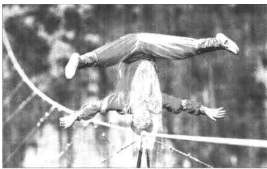
“高空王子”阿迪力成功挑战“天下第一坑”